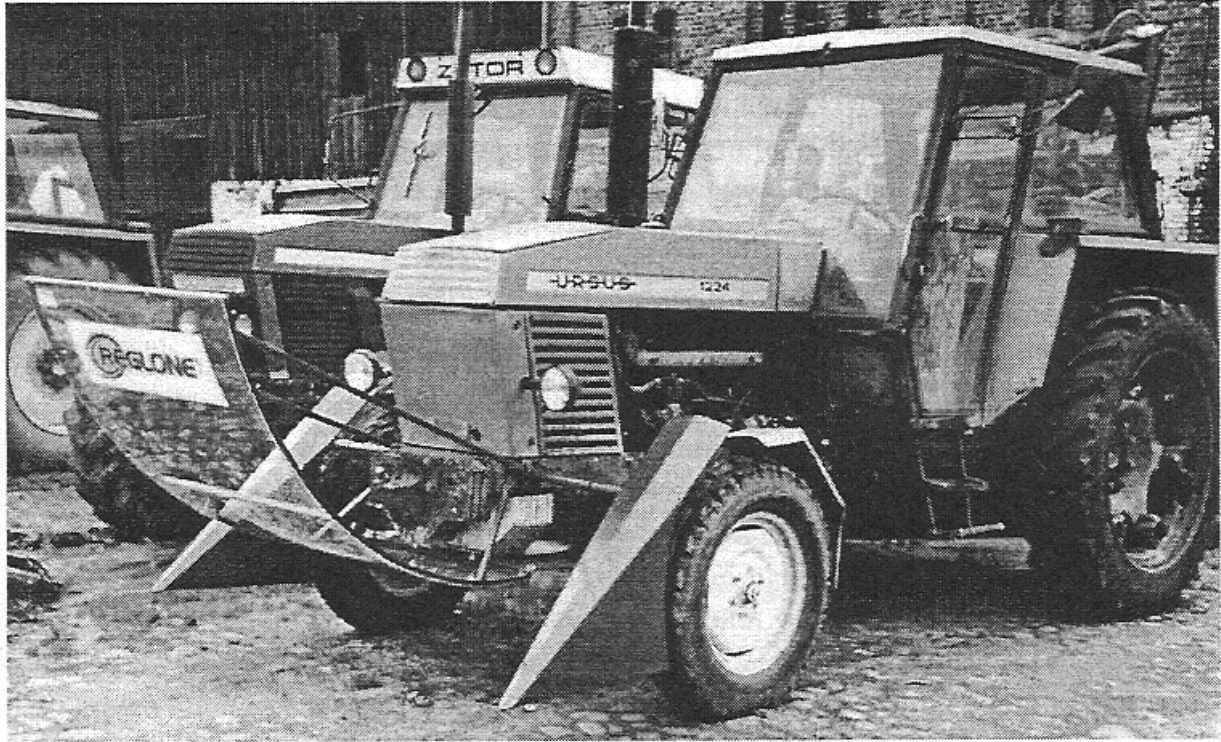
Rys. 1. Ciągnik agregatu opryskującego z ekranem, fartuchem i rozdzielaczami łąn Fig. 1. View of tractor of spraying aggregate with screen, apron and distributors of field

Na plantacjach wydzielono zagony o długości ok. 60 m i szerokości odpowiadającej szerokości roboczej agregatu opryskującego. W odległości ok. 20 i 40 m od skraju zagony, na całej jego szerokości, wykonano nożycami ręcznymi do cięcia