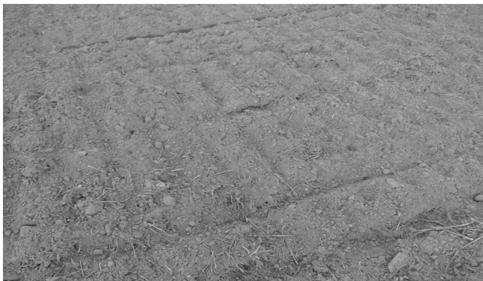
Rysunek 1. Gleba przygotowana do siewu w uproszczonej technologii uprawy roli Figure 1. Soil prepared for sowing in the simplified field technology