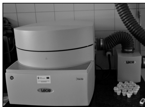
Rysunek 2. Zestaw do pomiarów termo-grawimetrycznych Figure 2. A set for thermal-gravimetric measurements