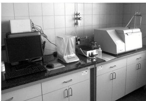
Rysunek 1. Kalorymetr LECO® AC500 Figure 1. LECO® AC500 calorimeter

Badania wartości opałowej biomasy przeprowadzone zostały na kalorymetrze LECO® AC500 (rys. 1). Oznaczenia zawartości popiołu w składzie chemicznym badanych gatunków podkładek drzewek owocowych wykonano metodą termo-grawimetryczną w aparacie firmy LECO - TGA701 (rys. 2). Natomiast analizę zawartości węgla (C), wodoru (H), azotu (N) dokonano na module CHN aparatu True Spec, a zawartość siarki (S) na module siarkowym.